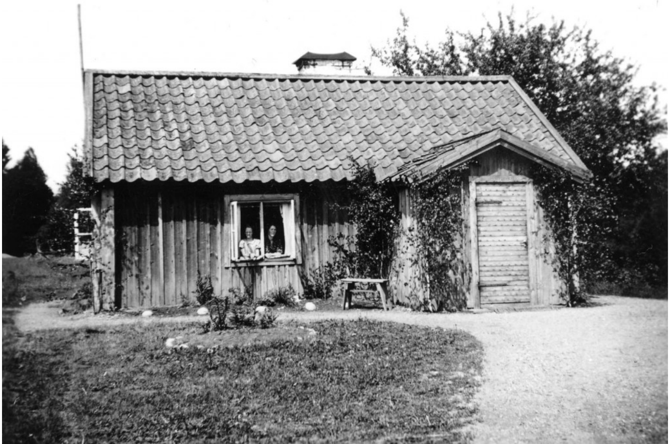
Stugan på Gullringen

Gullringen, ibland Guldringen, finns med i jordeböckerna från 1732 och i husförhörslängder och församlingsböckerna från 1746 in på 1950-talet. Här lite historia i "modern" tid.