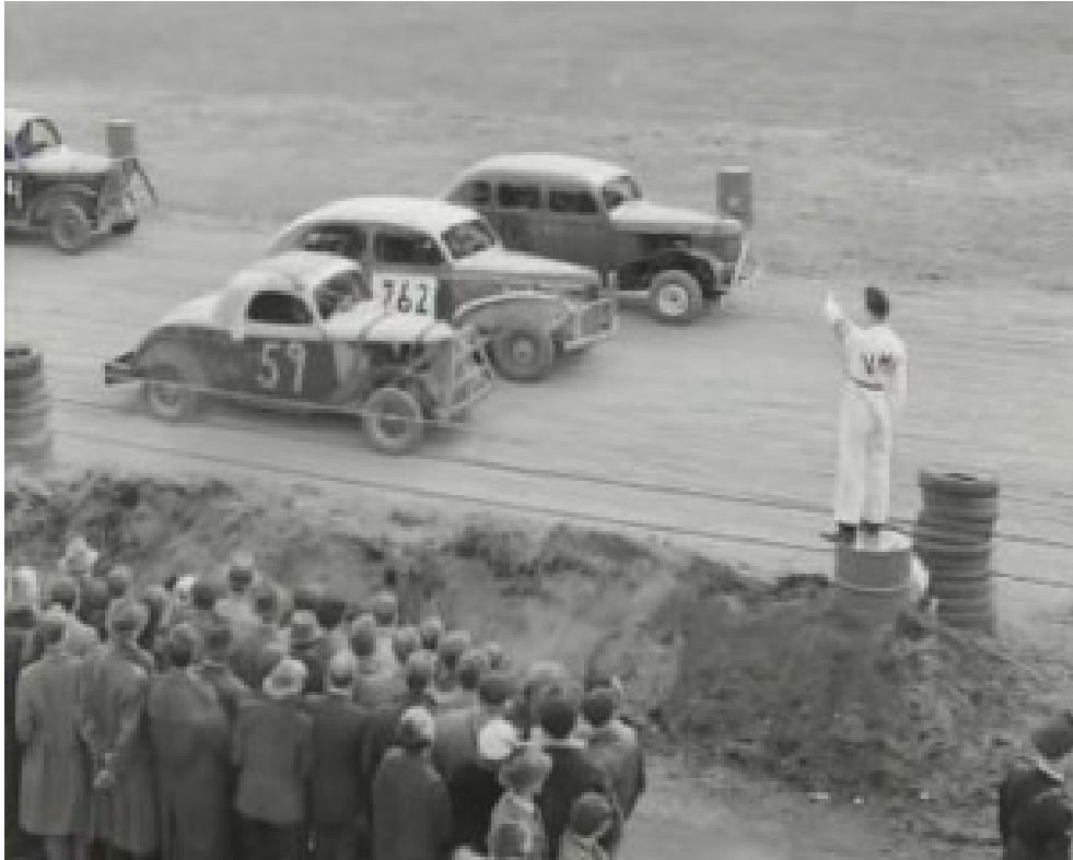
Klart för start, nån gång i mitten på 50-talet

Efter speedwayepoken på Södra Motostadion kom en ny gren av motorsport till Handen, Stock Car.