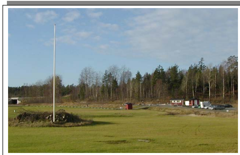
Fors Golf, prov. klubbstuga hösten

Även detta var ju naturligtvis kontroversiellt och diskussionens vågor gick höga i lokalpressen och vissa boende kände sig överkörda av markägaren. Trots protesterna växer nu banan fram med några hål per år och kommer väl att bli en normal 18-hålsbana inom de närmaste åren, många till glädje, andra till förtret.