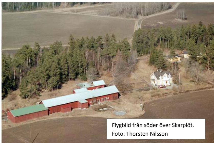
Flygbild från söder över Skarplöt.