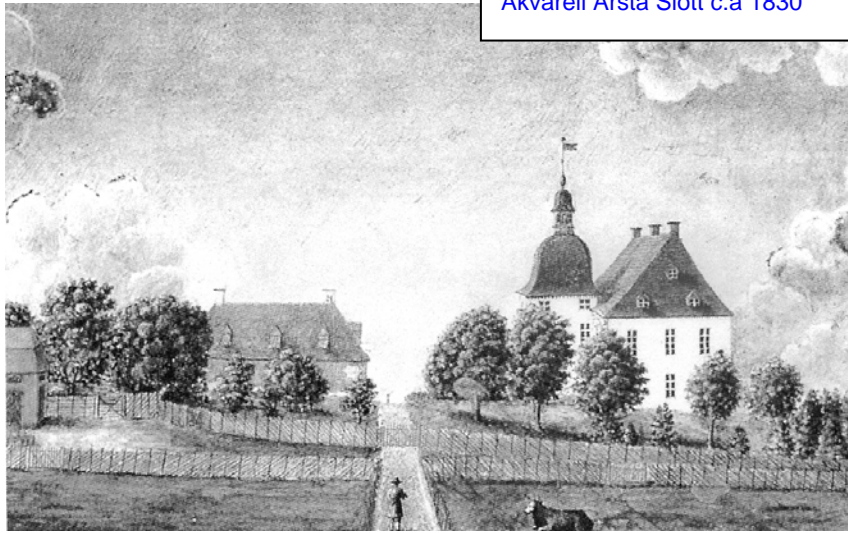
Akvarell Årsta Slott c:a 1830

"Hade jag vid fem och tjuugo års ålder fått se en syn, att jag tjuugo år senare skulle bebo samma ställe i ungefär samma förhållanden, se från samma lilla bädd solen gå upp om morgonen ...så tror jag, att jag kastat mig i sjön. Och nu är detta fruktade öde mitt, och jag är så tillfreds därmed, att jag ingen önskan har att förändra det väsentligt. Sant är likväl, att jag nu känner mig här lika fri, som jag förr var ofri; och att känna vingarna fria och buren öppen, det lugnar sinnet."