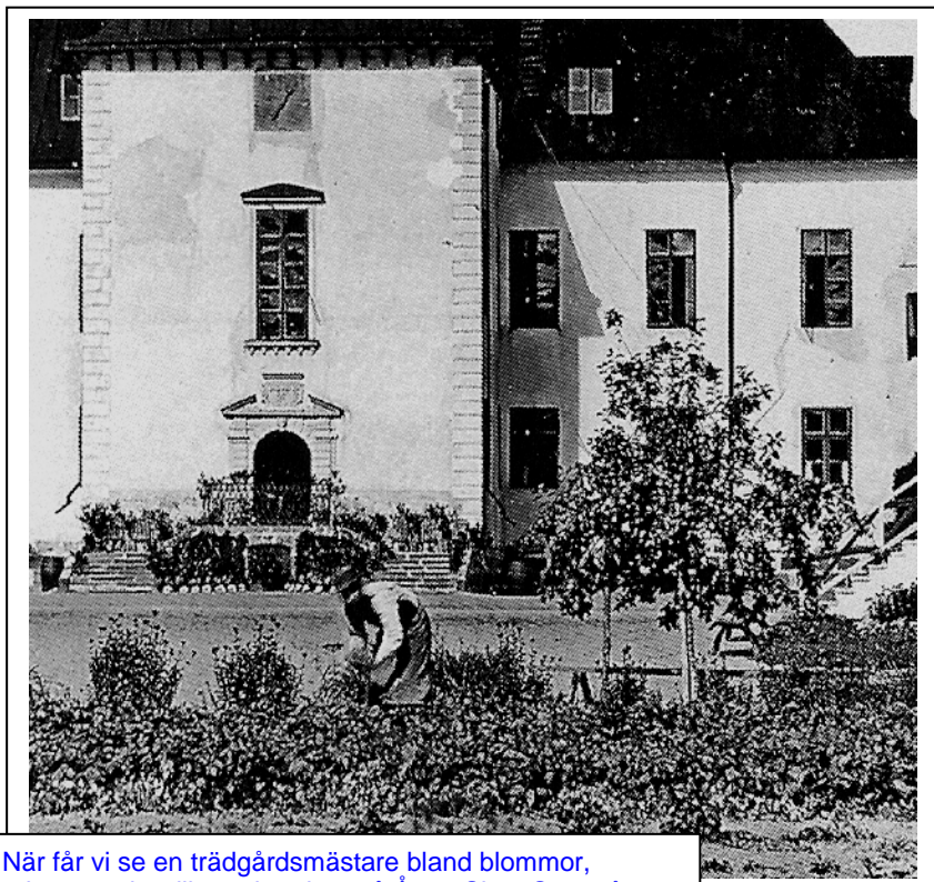
När får vi se en trädgårdsmästare bland blommor, rabatter och odlingar i parken på Årsta Slott. Som på denna gamla bild.

Årsta slott och säteri har en rik och spännande historia. Denna kan vi följa i de artiklar som publicerats i Glimtar. Korsfarare, riksföreståndare, amiraler, kulturpersonligheter, förläggare, köpmän och byggbolag har ägt Årsta. Numera ägs slottet av Haninge kommun och markerna i första hand av ett byggbolag och av Lars Fröstad (min bror).