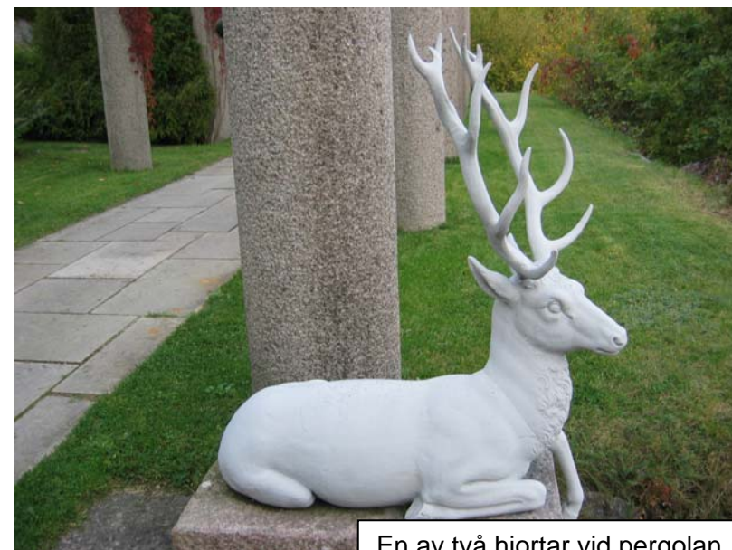
En av två hjortar vid pergolan. mer lik en kronhjort än en dovhjort.

Mest omtalade är nog de kungliga jakterna där skrönorna om tillrättalagda skottillfällen för den gamle monarken är många. Hovjägmästaren hade inhägnad ett stort område, viltstängslet lär ha varit 3,5 mil långt, där stora hjordar av dovhjortar och rådjur planterades in och en stor mosse dikades ur för att passa tillvaron för landets första kanadagäss. Under en kortare tid fanns här också några visenter som senare flyttades till Avesta.