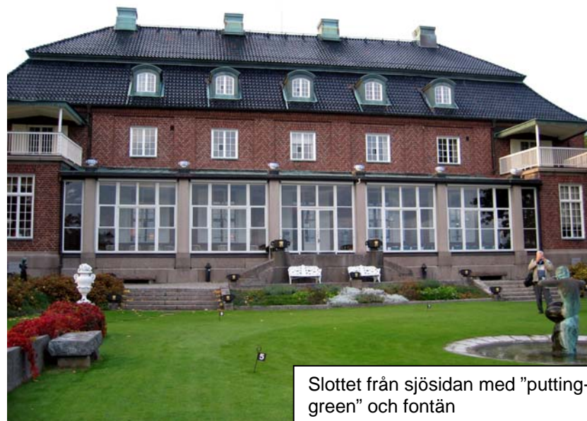
Slottet från sjösidan med "putting-green" och fontän

Men så blev Berga en samlingspunkt för dåtidens nobless med konungen Gustaf V som galjonsfigur, den gamle monarken hedrades med en hel avdelning på andra våningen i slottet som alltid stod till förfogande, troligen var det den del av slottet som var tänkt för familjelivet men hovjägmästaren (han utnämndes 1922) förblev ogift men hade troligen inte riktigt tänkt sig detta i sin ungdom, på slottets originalritningar finner man både barnkammare och rum för barnpigor och på fasaden har han lämnat plats för en ev. hustrus monogram.