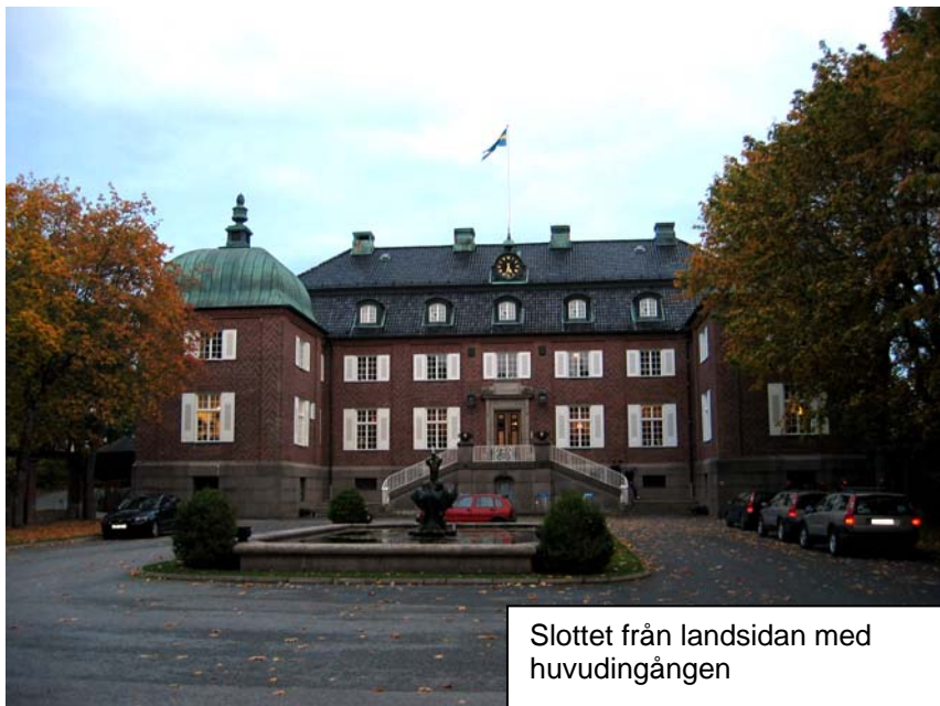
Slottet från landsidan med huvudingången

En vacker hösteftermiddag i oktober 2004 besökte jag tillsammans med Dokumentationsgruppen i Haningegillet Bergaområdet.