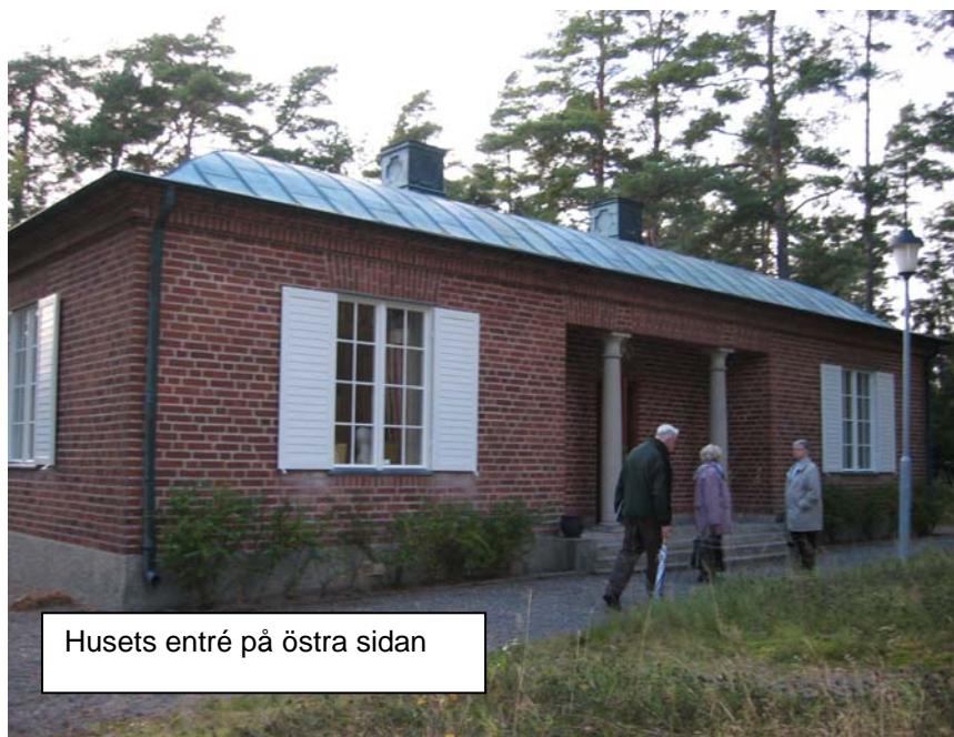
Husets entré på östra sidan