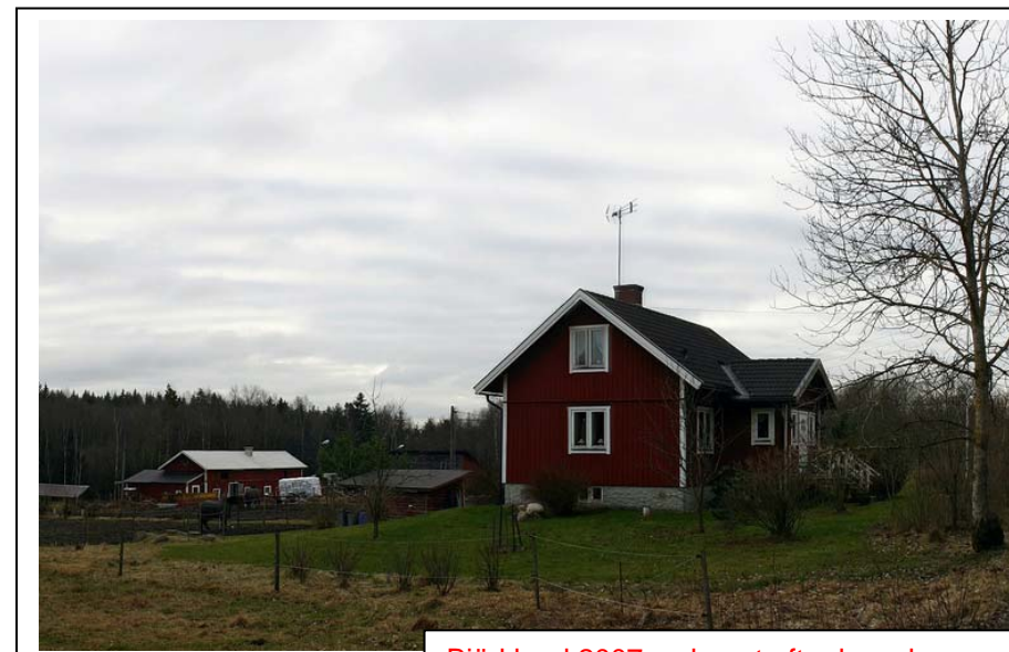
Björklund 2007, nybyggt efter brand