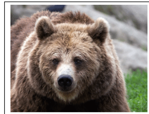
Ovan en svartbjörn och t.h en grizzly. En gammal grizzlyhanne kan väga upp mot 600 kg medan svartbjörnen kommer upp i max 400 kg

På första jakt dagens eftermiddag hoppade det fram en svartbjörn framför bilen. Jag var tillsagd att sitta beredd med vapnet i ena handen och ett skott i den andra. Man kan inte färdas i bil med laddat vapen. Björnen sprang hoppande framför bilen. Är jägaren rättvänd i huvudet skjuter man inte djuret bakifrån, jag lät bli att ladda vapnet. Vi skulle jaga i sex dagar och våra fantastiska upplevelser fotograferades och dokumenterades av min bror Björn.