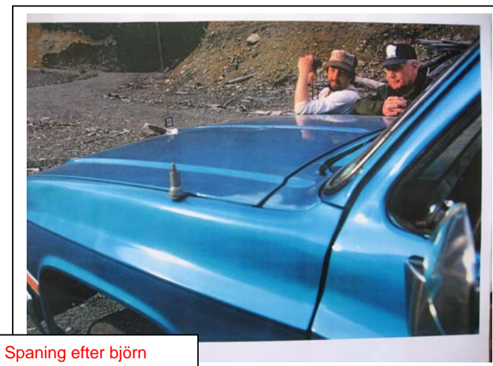
Spaning efter björn

Från Vancouver gick transporten vidare till Hope med bil, en sträcka på 16 mil och till bergen vid Cariboo Mountains i västra Kanada. En bergskedja med varierande höjd, från 1300 till 3800 meter.