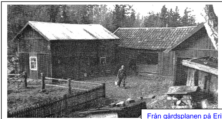
Från gårdsplanen på Erikslund 1963

För att kunna existera på ett torp som Erikslund, ca 3 hektar åker, var både man och hustru tvungna att hjälpas åt med de olika sysslorna. Att det hela skulle fungera berodde både på människor och djur. Djuren var på ett sånt här torp familjemedlemmar. Hästen var ju den viktigaste av djuren, han medverkade i en stor del av inkomsten på torpet.