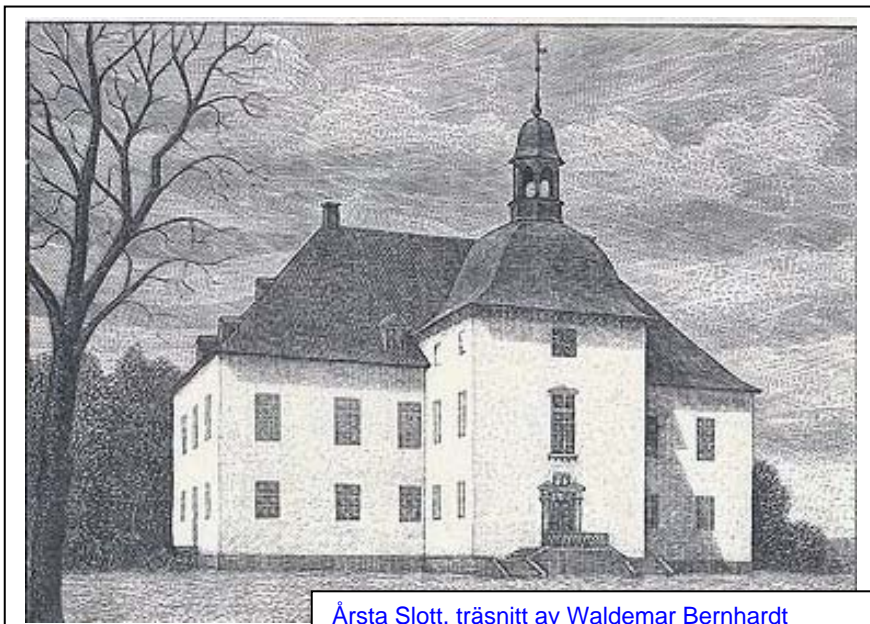
Årsta Slott, träsnitt av Waldemar Bernhardt

av Harry Runqvist, Österhaninge socken, utgiven 1961