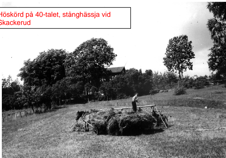
Höskörd på 40-talet, stånghässja vid Skackerud