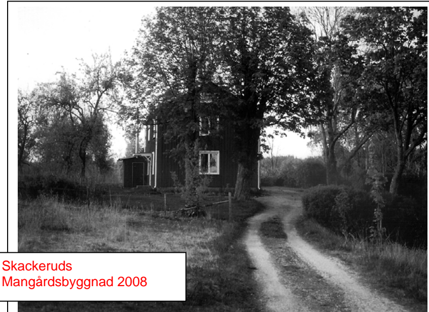
Skackeruds Mangårdsbyggnad 2008