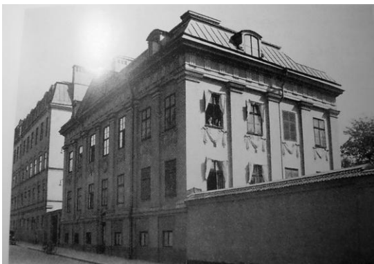
Den till Inrättningen donerade fastigheten vid Wollmar Yxkullsgat - Prästgårdsgatan

Verksamheten bedrevs med donationer och avkastning därav. Ekonomin var under 1830-talet mycket god. Från 1832, med 26 barn, hade antalet stigit till 105 barn åren 1838 – 1841. Sedan hölls ungefär det antalet fram till 1851. Från slutet av 40-talet sjönk tillgångarna så att man tvingades minska antalet barn. Det minskade till 87 barn 1852 och 75 i juli 1853.