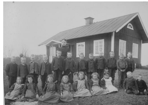
Småskolan Berget med elever och lärarinnan

Från början var undervisningen endast avsedd för fosterbarnen. Detta ändrades senare så att även arrendatorernas egna barn fick gå i samma skola.