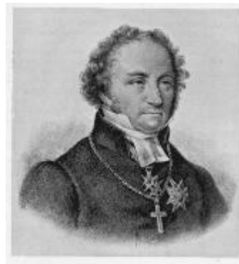
Johan Olof Wallin