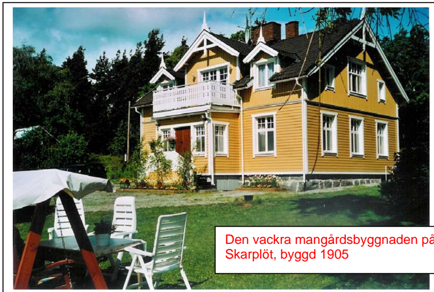
Den vackra mangårdsbyggnaden på Skarplöt, byggd 1905