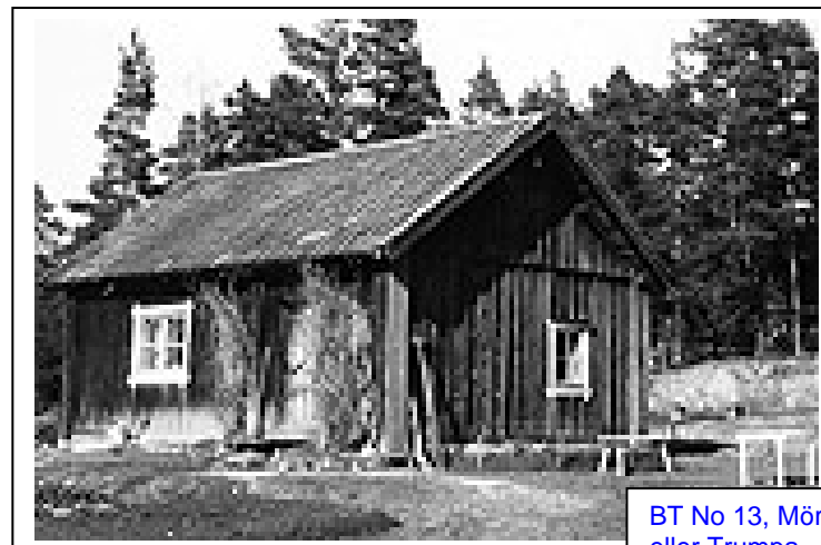
BT No 13, Mörbergstorp eller Trumpa

Denna artikel är tidigare publicerad i Gillets medlemsblad Fragment (2/1984)