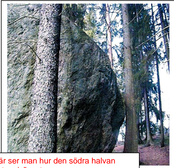
Här ser man hur den södra halvan "lutar sig" mot en gran som uppskattningsvis är 40-50 år gammal

Den södra halvan av stenen "lutar" sig mot ett par granar, inte alltför grova, det ser nästan ut som att det är träden som håller den på plats. Utan säker kännedom om trädens ålder kan man ändå anta att stenen fått sin utformning tiotusentals år före dessa träd vuxit upp så teorin om stötningen är som alla förstår felaktig. Troligen hålls den lutande delen på plats av någon utstickande del eller lösa stenar under marken.