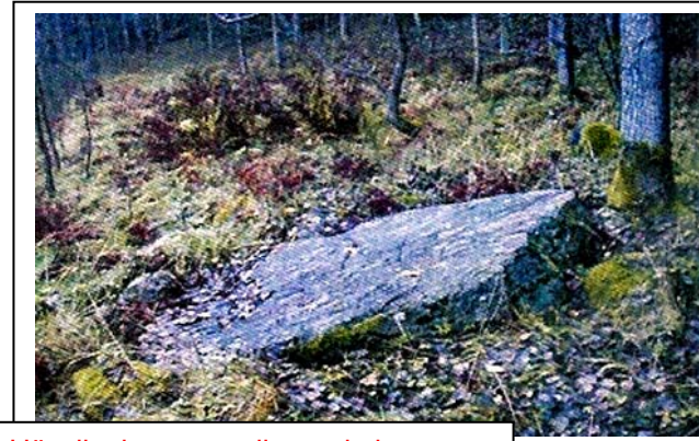
Hässlingbystenen, liggande i åkerkanten. Finns utmärkt med "Run-R" på kartan på första sidan.

Intill Kalvsviks kluvna sten, några hundra meter SSV, finns en s.k. offerkälla, från vilken tidsperiod stammar den, vad finns skrivet om denna?