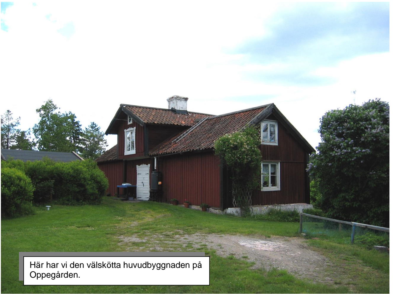
Här har vi den välskötta huvudbyggnaden på Oppegården.

Söndagen avslutades med förtäring och källarsval öl hos Ragnhild och BOB på Grindstugans veranda med en vidunderlig utsikt över Väsbyfjärden och Sandemars Naturreservat