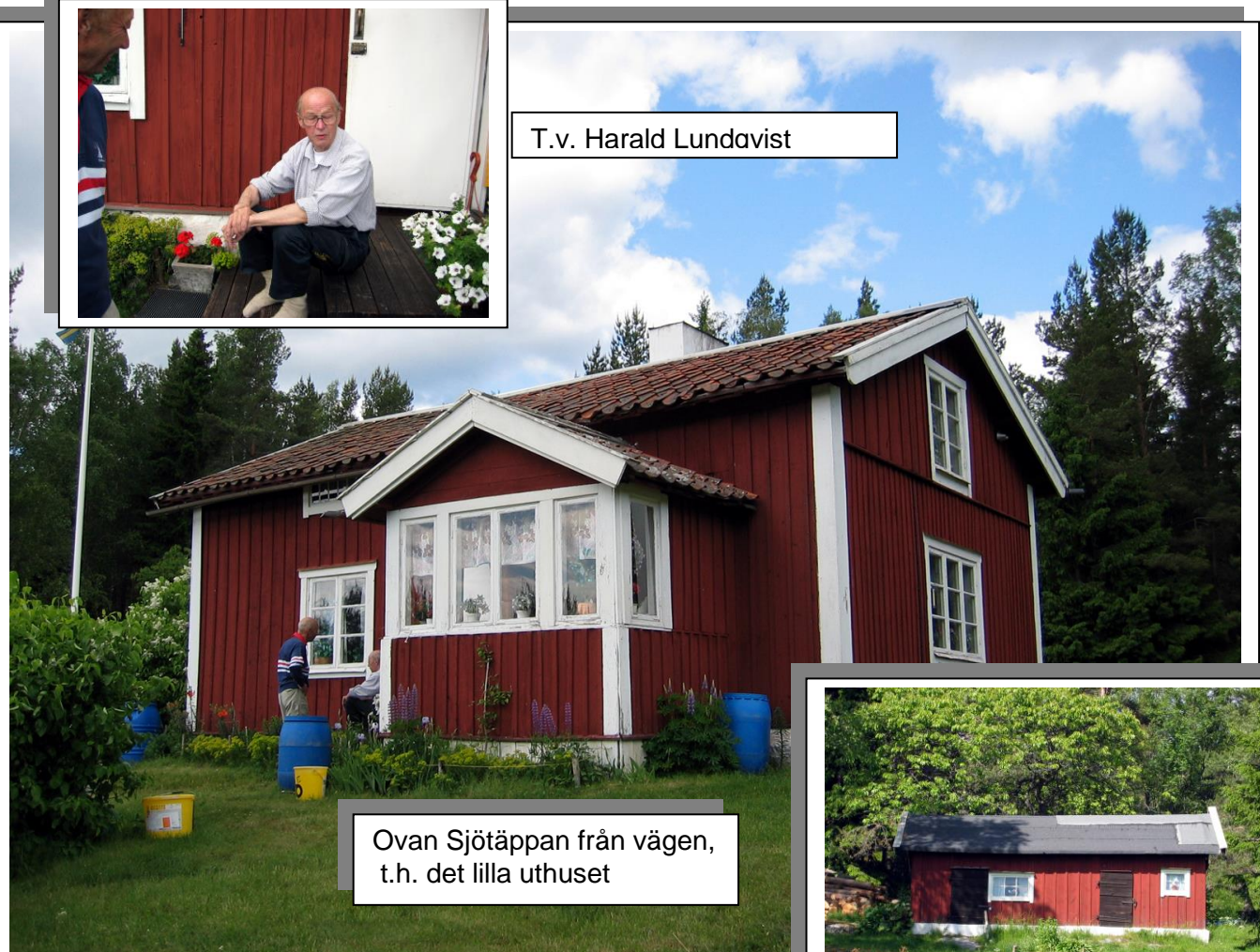
Ovan Sjötäppan från vägen, t.h. det lilla uthuset