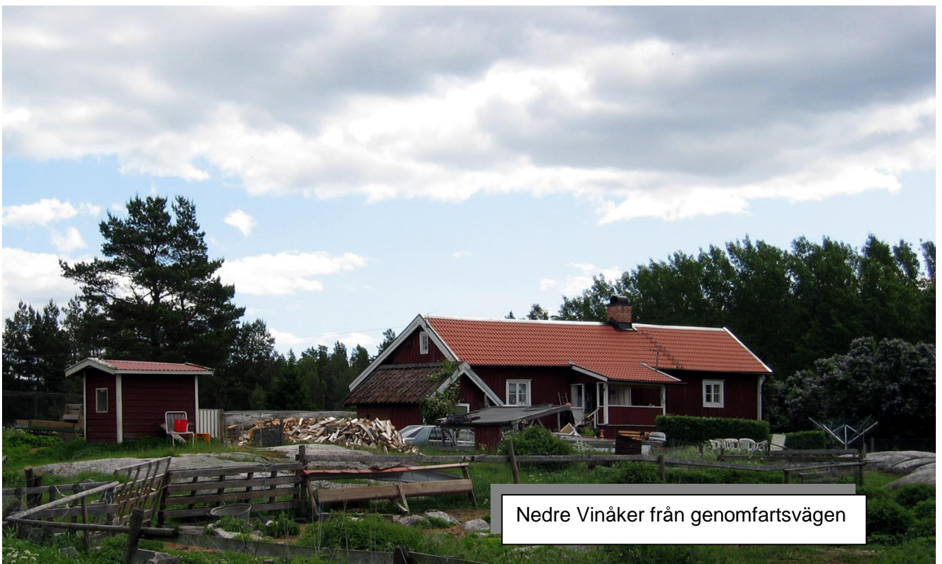
Nedre Vinåker från genomfartsvägen