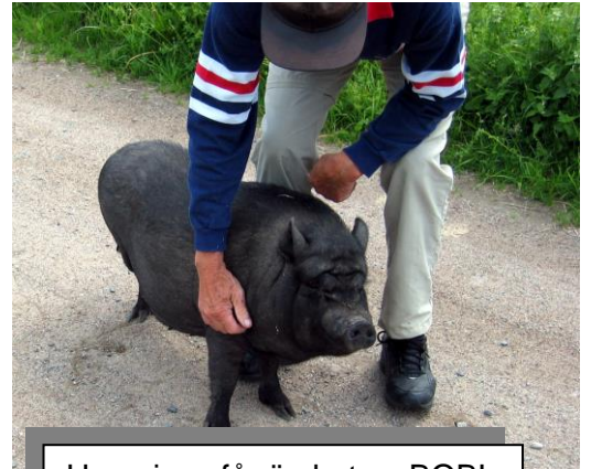
Husgrisen får ömhet av BOB!

Vi får veta att Vinåker är beskrivet i hävderna långt före Dalarö och att ursprungsnamnet är "Winock". Byggherren till det nuvarande träslottet Sandemar, gamle Falkenberg, skrev sitt namn "Falkenberg af Vinåker" redan på 1600 talet.