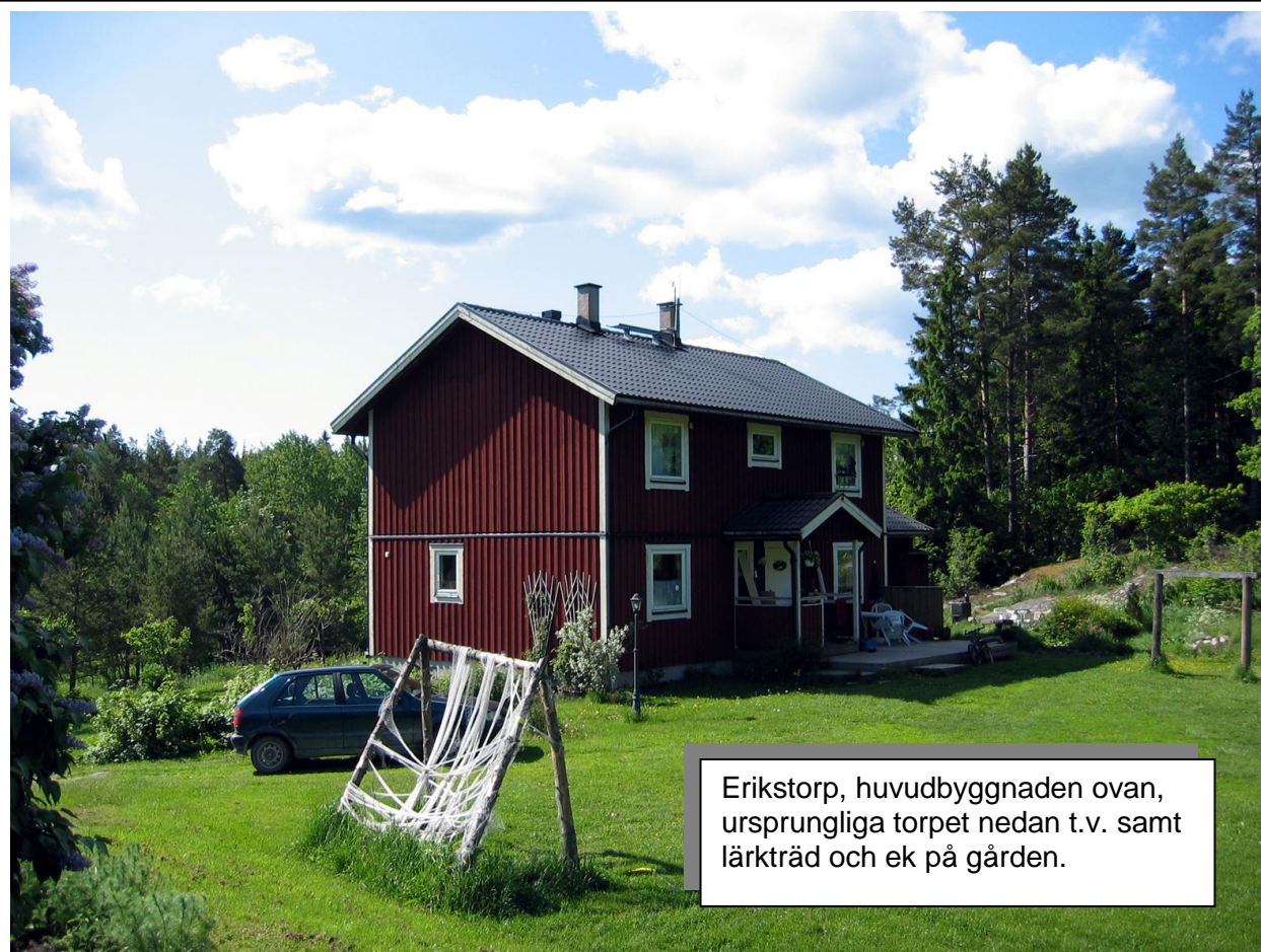
Erikstorp, huvudbyggnaden ovan, ursprungliga torpet nedan t.v. samt lärkträd och ek på gården.

I strålande väder kom vi upp till bommen mot Stockholms Stads marker vid Styvnäset men stannade vid Erikstorp. Numera friköpt från Sandemar.