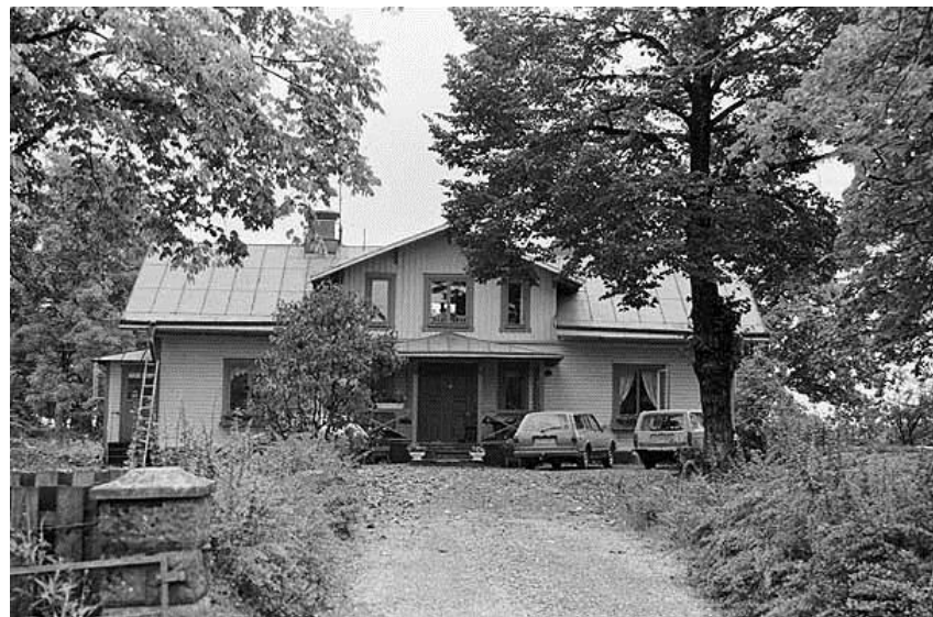
Modern bild av Länna Gästgiveri, nu privatbostad