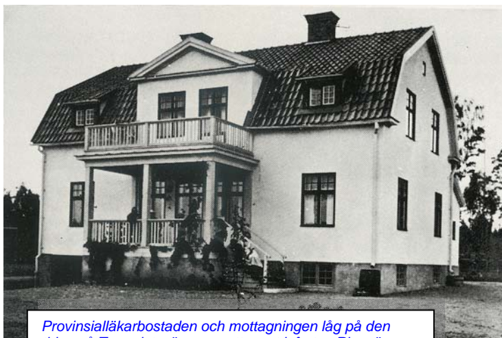
Provinsialläkarbostaden och mottagningen låg på den tiden på Tungelstavägen, snett emot infarten Ringvägen, senare förlossningshem, sjukkassa och byggnadskontor