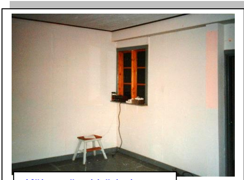
Köket när vi började...

Våren 1991 började den stora ombyggnaden av kvarnen. 2,5 ton isolering skulle bäras från parkeringen ner till huset. Det var upptakten till det stora jobbet som väntade oss. Efter 6 veckor med två snickare var det dags för Janne att ta över. Bostaden skulle göras på två av de tre planen kvarnen består av. På övre planet två sovrum, TV-rum och badrum. På