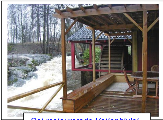
Det restaurerade Vattenhjulet

När vi vaknade nästa morgon hoppades vi att vi bara haft en ond dröm. Det var svårt att tro att nattens oväder varit verkligt. Vi gick ut för att titta på förödelsen. Nästan hela sådden hade spolats bort och de precis grodda fröna låg i drivor längst ner i trädgården. I jorden hade det blivit stora vattenfyllda kratrar. Hela dagen gick åt att försiktigt sopa tillbaka alla gräsfrön och jämna till gropar och ojämnheter.