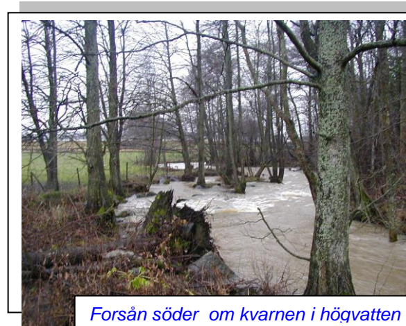
Forsån söder om kvarnen i högvatten