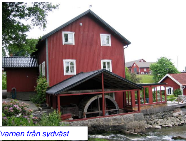
Kvarnen från sydväst

Under ombyggnaden av kvarnen bodde vi i mjölnarstugan. Men för att kunna göra det måste vi dra in vatten och installera tvättmaskin och toalett.