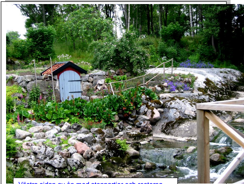
Västra sidan av ån med stenpartier och resterna av gamla kommunala tvättstugan.

För närvarande gör vi en större renovering av mjölnarstugan. Vi har tagit fram det gamla taket i rummet och fann gamla vackra stockar. Vi har renoverat den öppna spisen och slipar och målar både hus och möbler för fullt. Huset är tänkt att bli gästhus främst för barn och barnbarn, men givetvis också för långväga gäster. Sysslös är man ju aldrig när man bor så här, men det hör ju till. Vi får ju så väldigt mycket tillbaka.