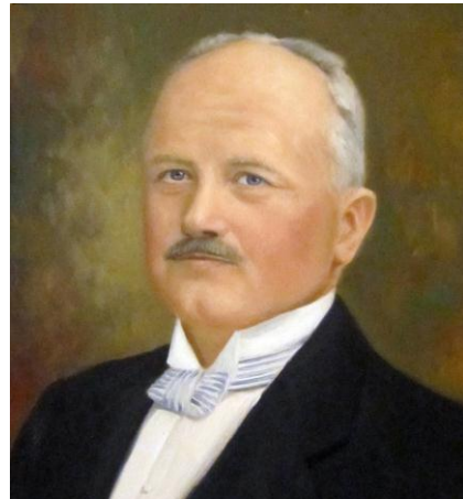
Detta porträtt finns också i Tingshuset, okänd konstnär, möjligen signerad G Borg eller Berg.