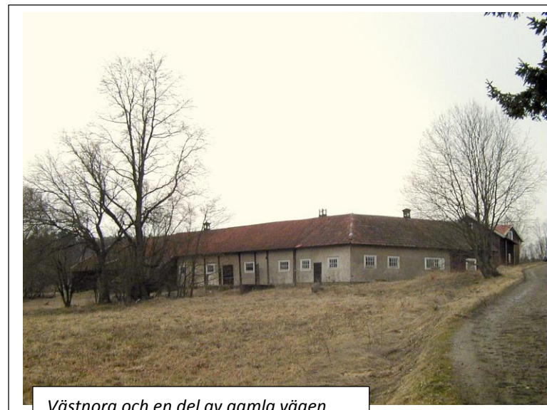
Västnora och en del av gamla vägen

Det större sandtaget längre fram utgör nu förvaringsplats för vägförvaltningen, men innan det togs upp befann sig här lägenheten Näspärlan eller Näspärla. Husen är sedan länge borta men namnet lever