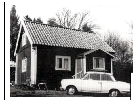
Stolpes torp, nu på Gansta