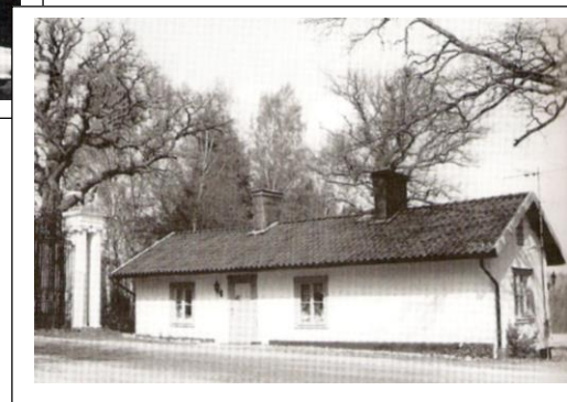
Häringe grindstuga, ej att förväxla med Häringe Grind