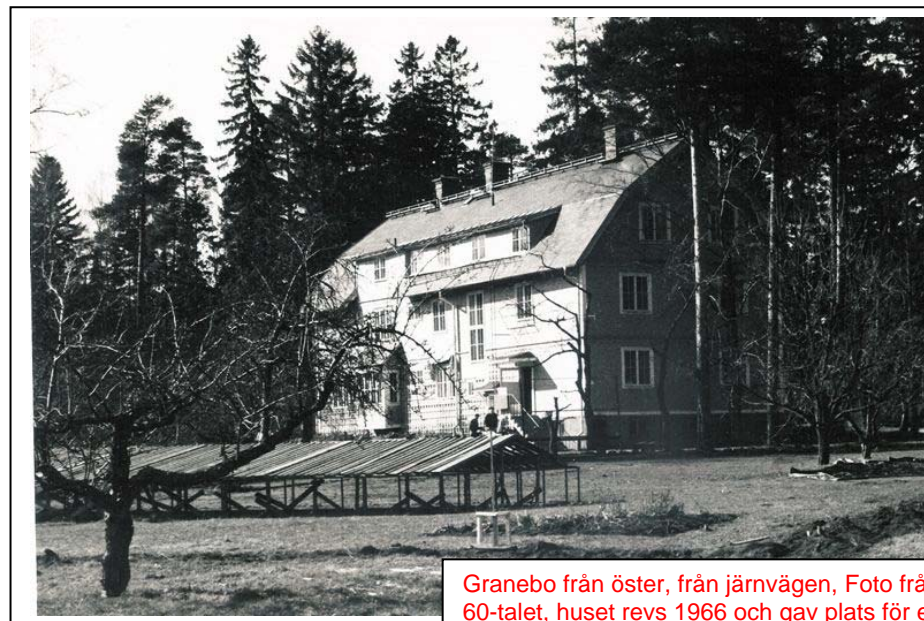
Granebo från öster, från järnvägen, Foto från 60-talet, huset revs 1966 och gav plats för ett antal hvreshus

Det kanske skall framhållas att just när det gällde Granebo, så var ofta meningarna som: – Det sades.., – Jag har hört.., – Det var dom som sett.., osv. Hur mycket som helst, allt för att uttrycka det andra sett och hört --och gärna förstärka det intill abnormitet.