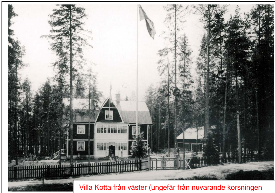
Villa Kotta från väster (ungefär från nuvarande korsningen Parkvägen/Tungelstavägen) Troligen byggd i början på förra seklet, döptes om till Granebo i samband med ägarbyte 1914.