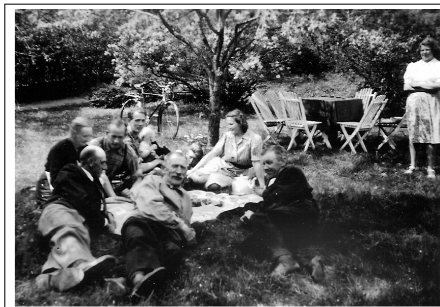
Den här bilden är tagen i Larssons trädgård omkring 1942.

Vi kan kanske avsluta den här verksamheten med att kalla platsen för "Håga Plantskola"!