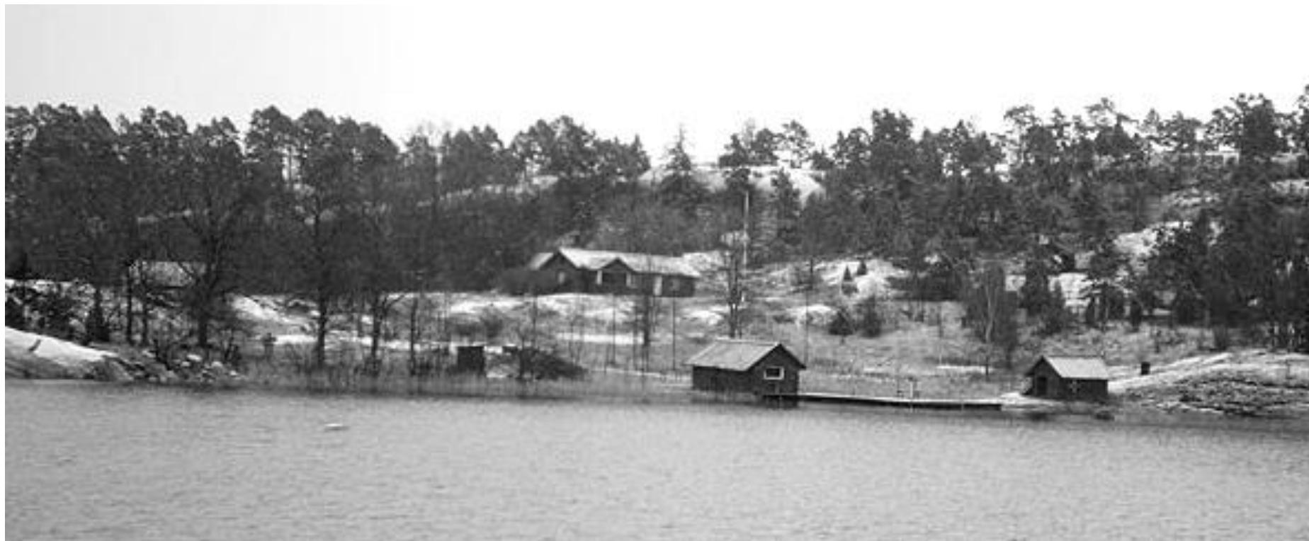
Havstornsudd 1964

Namnet på torpet som ligger otillgängligt till, om man vill ta sig dit landvägen, har stavats på olika sätt. Eller hetat olika om man så vill. I den första husförhörlängden (hfl) står det " Havstorpsudd ". En bit in på 1800-talet har det kallats " Hagtornsudd ". Först någon gång på 1900-talet har det börjat kallats " Havstornsudd ". I mantalslängderna (mtl) från 1660-talet till