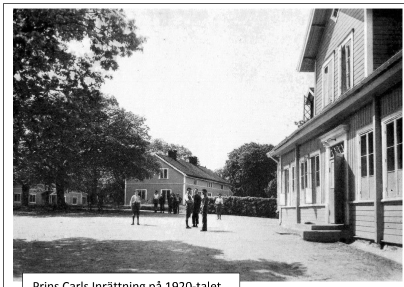
Prins Carls Inrättning på 1920-talet