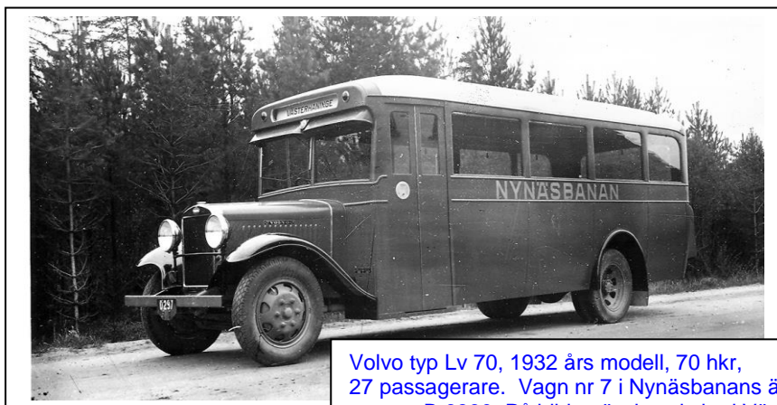
Volvo typ Lv 70, 1932 års modell, 70 hkr, 27 passagerare. Vagn nr 7 i Nynäsbanans ägo, reg. nr. B 6860. På bilden är den skyltad Västerhaninge, men det framgår inte varifrån, eller var den befinner sig.

Någon gång under det sena 20-talet började Konrad Gustavsson i Västerhaninge att köra en linje mellan Västerhaninge station och Årsta Havsbad. Tyvärr finns det inget exakt årtal för den starten. Däremot vet man att han bl. a. hade en buss av märket Studebaker.