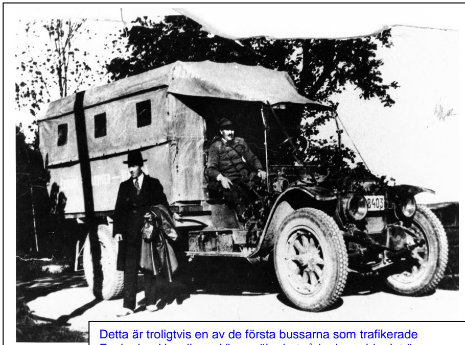
Detta är troligtvis en av de första bussarna som trafikerade Enskede - Hanviken. Viss osäkerhet råder huruvida det är Carl Gustav Ferdinand Ring som sitter vid ratten. På sidan står det textat Enskede-Hanviken-Vendelsö. Okänd fotograf, fotot ur Runar Alvesäters samlingar.

(Backspegeln nr 5, ©copyright Mauritz Henriksson 1999)