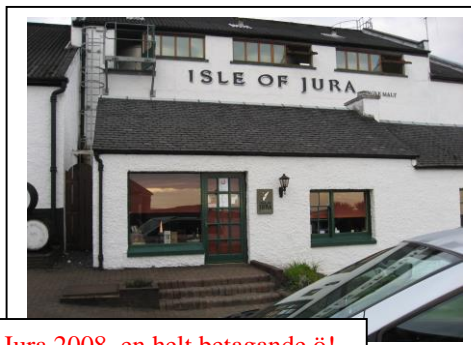
Jura 2008, en helt betagande ö!

Isle of Jura, ett ensligt beläget destilleri på ön Jura, en ö med 200 innevånare, en by, en väg, ett hotell och tusentals kronhjortar!