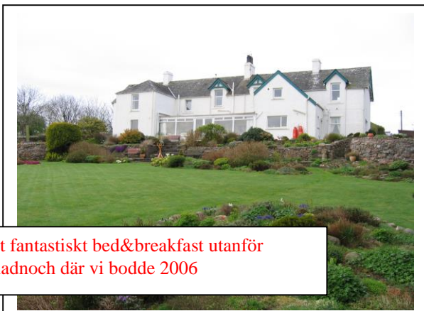
Ett fantastiskt bed&breakfast utanför Bladnoch där vi bodde 2006