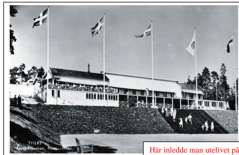
Här inledde man utelivet på 50-talet

grogg och restaurangens räksmörgås räknades tydligen som mat och blev alibi för spritleveranserna.