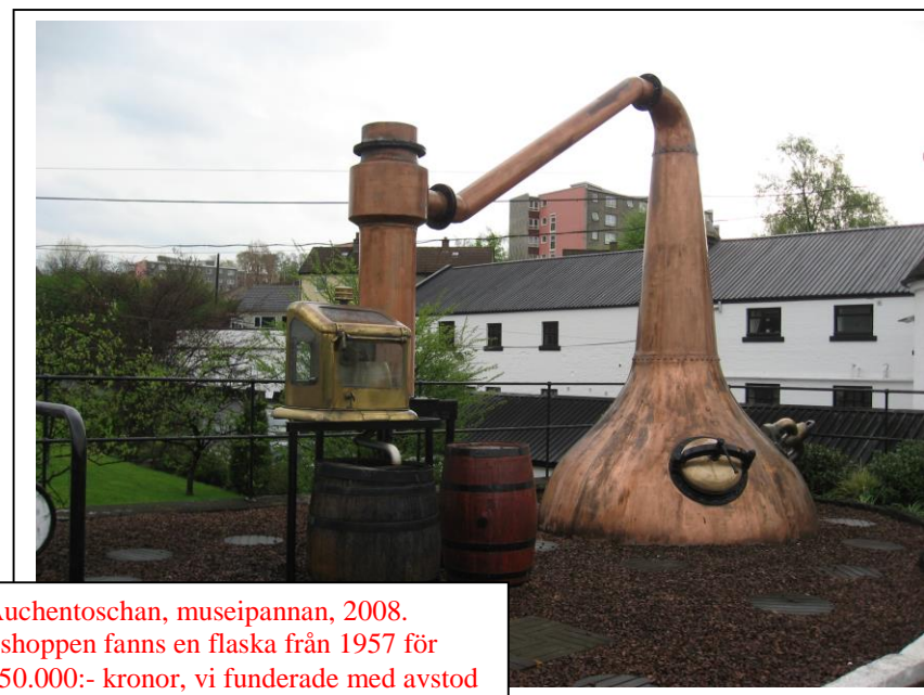
Auchentouschan, museipannan, 2008. I shoppen fanns en flaska från 1957 för 250.000:- kronor, vi funderade med avstod

Det tveklöst vackrast av dem alla är Auchentouschan i Glasgows förstäder och som god två, Mcallan vid floden Spey i högländerna.