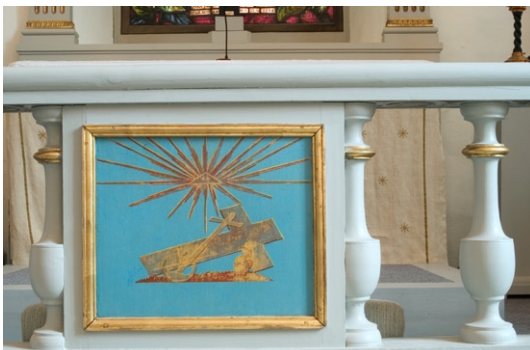
Konsler och utsmyckning på altarringen.