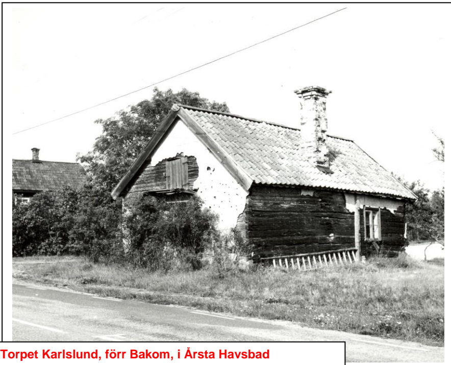
Torpet Karlslund, förr Bakom, i Årsta Havsbad

Ligger vid norra utfarten mot Årsta slott, Byggnaden i förgrunden numera borta, tv skymtar det nuvarande huset, flyttat hit 1917