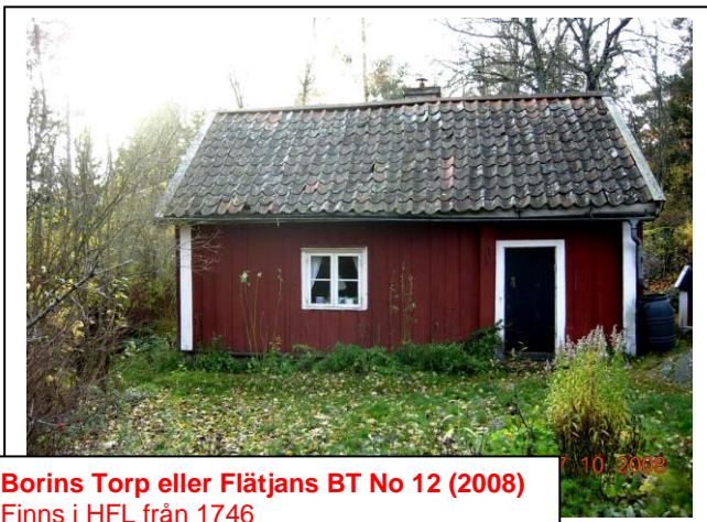
Borins Torp eller Flätjans BT No 12 (2008) Finns i HFL från 1746