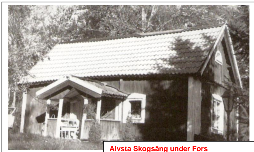
Alfsta Skogsäng under Fors