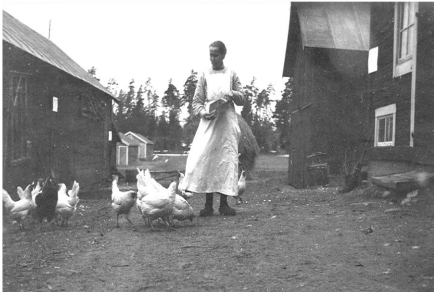
De hade höns, en gris, två kor och en häst, Putte.