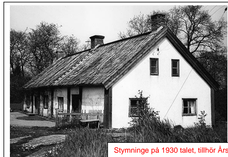
Stymninge på 1930 talet, tillhör Årsta