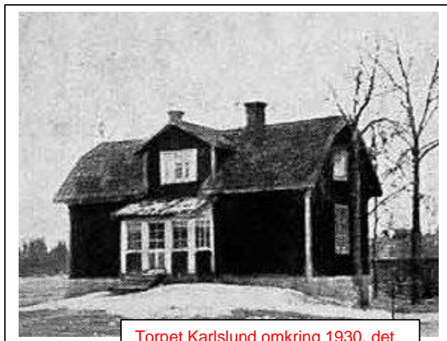
Torpet Karlslund omkring 1930, det gamla torpet Bakom låg här intill