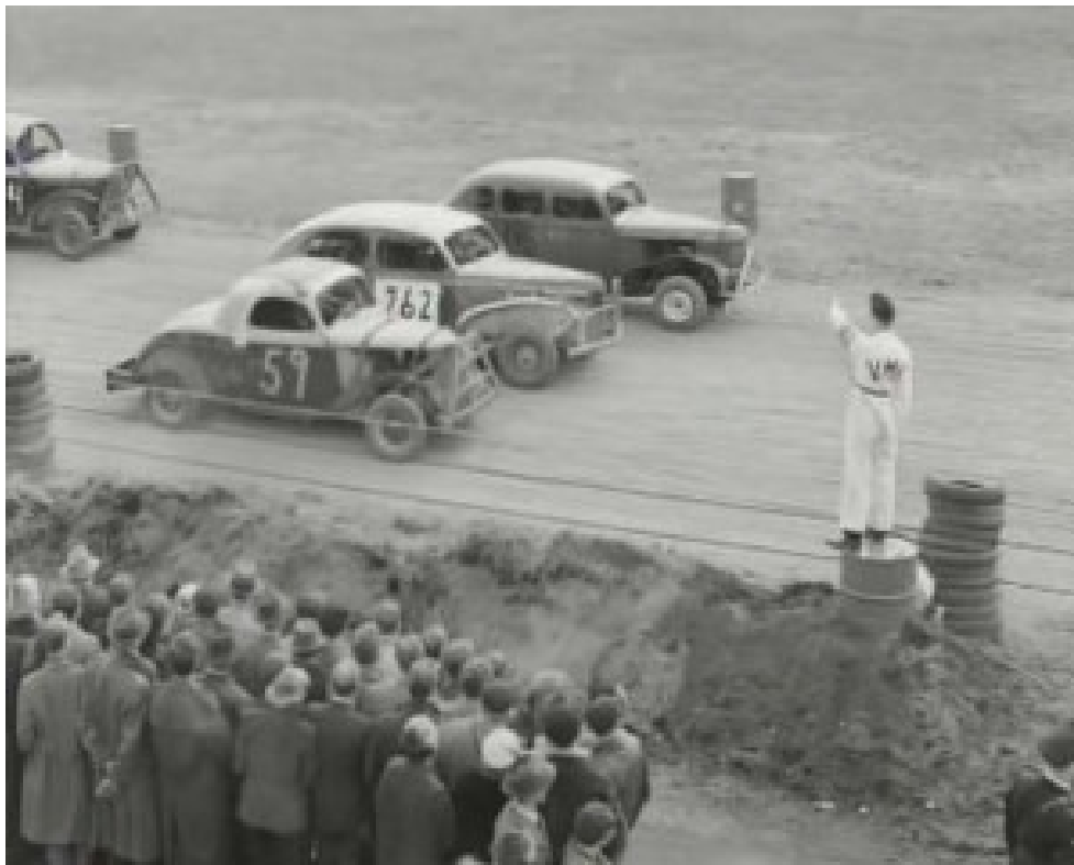
Klart för start, nån gång i mitten på 50-talet

Efter speedwayepoken på Södra Motostadion kom en ny gren av motorsport till Handen, Stock Car.