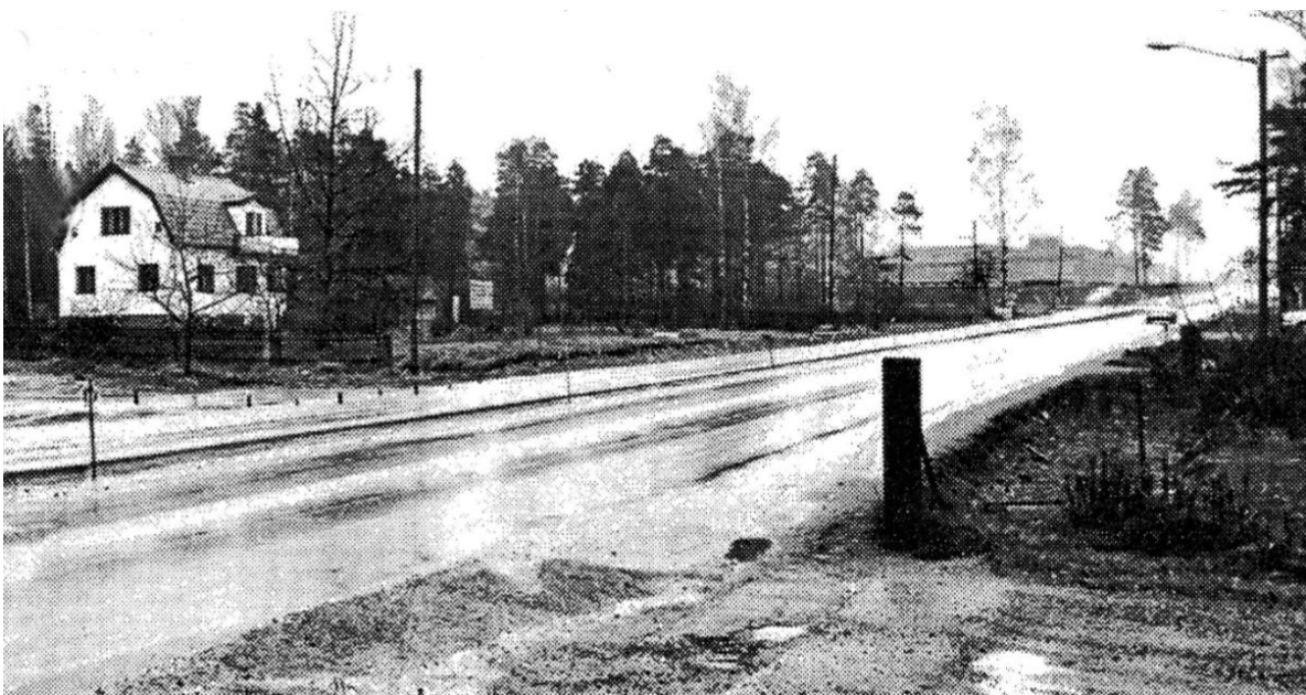
Nynäsvägen mot söder, uppe i backen skymtar centrumbygget!

Alla som bodde i området där sjukhuset nu ligger blev mer eller mindre överkörda. Många blev gamla i förtid, sjuka, och några flyttade ifrån kommunen. Utvecklingen i ett samhälle kan man inte göra så mycket åt men allt kan göras med takt och förståelse för de som byggt sina hus och bostäder med egna händer och förväntar sig att få bo där i lugn och ro tills de själva tar avsked.