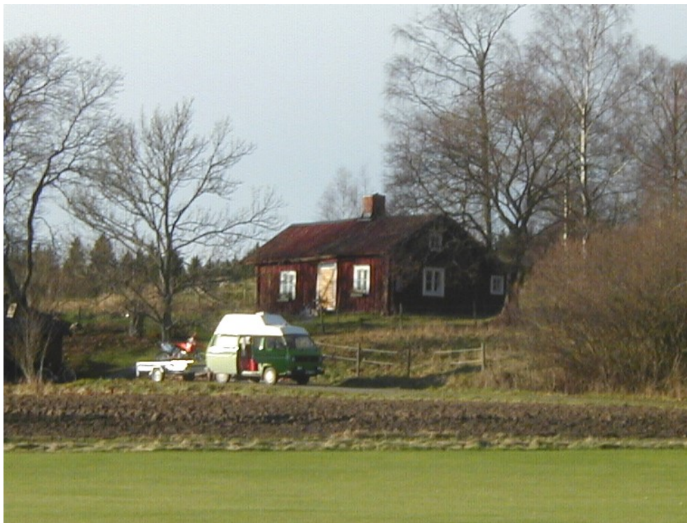
Brobystugan på Husby.

Det är för mej okänt när byggnaderna försvann från sin ursprungliga plats men åtminstone en stuga har flyttats till skogsbacken söder om Husby och används idag som permanentbostad.