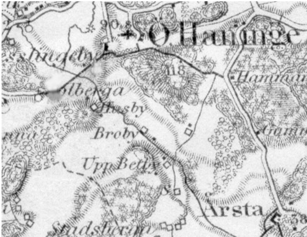
Generalstabskartan c:a 1880

Det är för mej okänt när byggnaderna försvann från sin ursprungliga plats men åtminstone en stuga har flyttats till skogsbacken söder om Husby och används idag som permanentbostad.