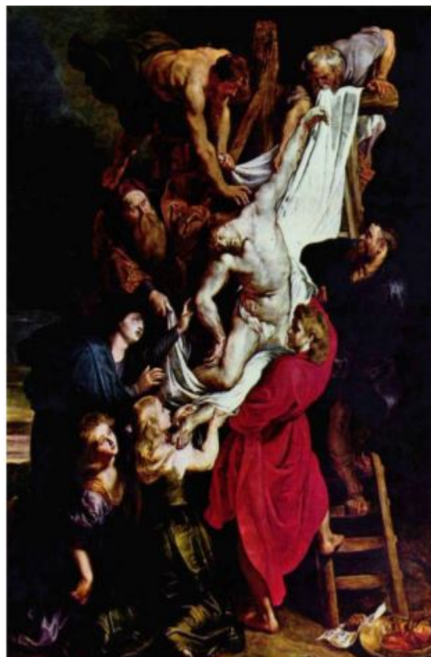
Rubens original finns att bese i Antwerpens domkyrka

Bilden på Rubens tavla är publicerad enligt "GNU Free