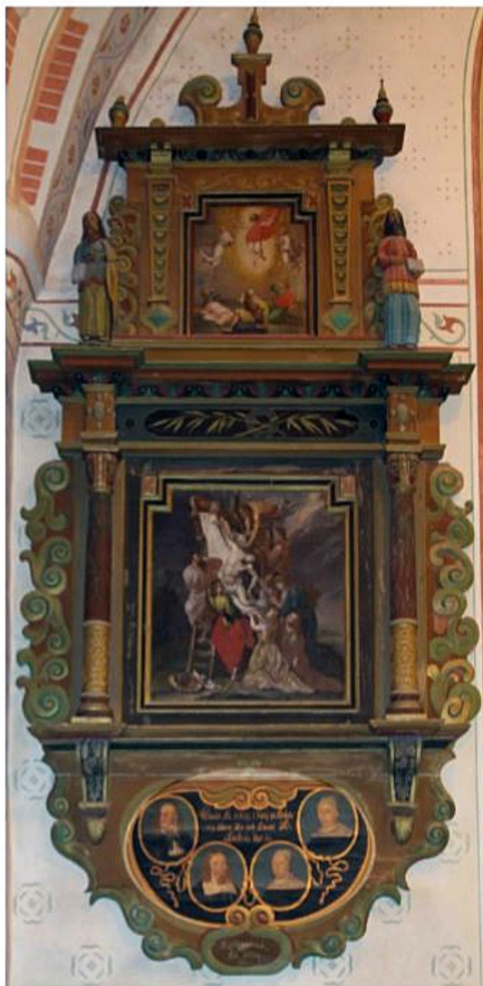
Lilles epitafium i Österhaninge kyrka målad av David Sudermannus år1669