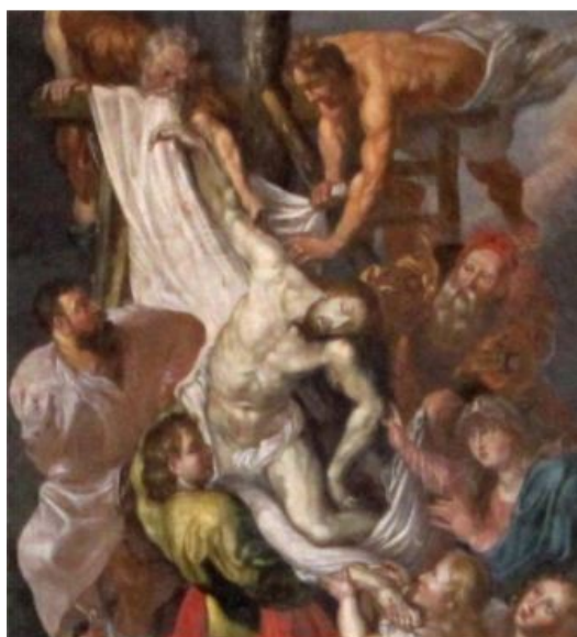
Detalj ur tavlan

Mycket nöjd klämde jag dit en bild av hans porträtt i min berättelse om Sanda. Jag kände sympati för mannen på bilden. Det ser ut som om han ber Gud om förlåtelse för allt elände han ställt till med som chef för fogdarna.