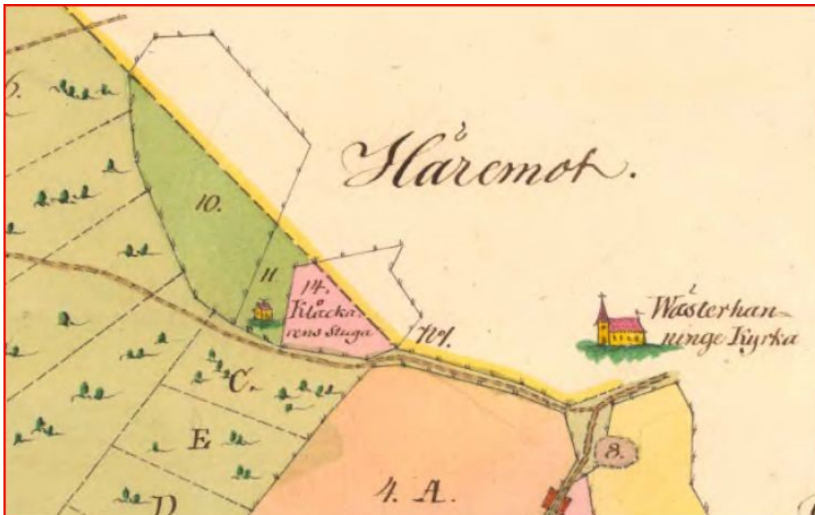
Karta från Ribby bys skogsmark, hagar och täppor år 1772