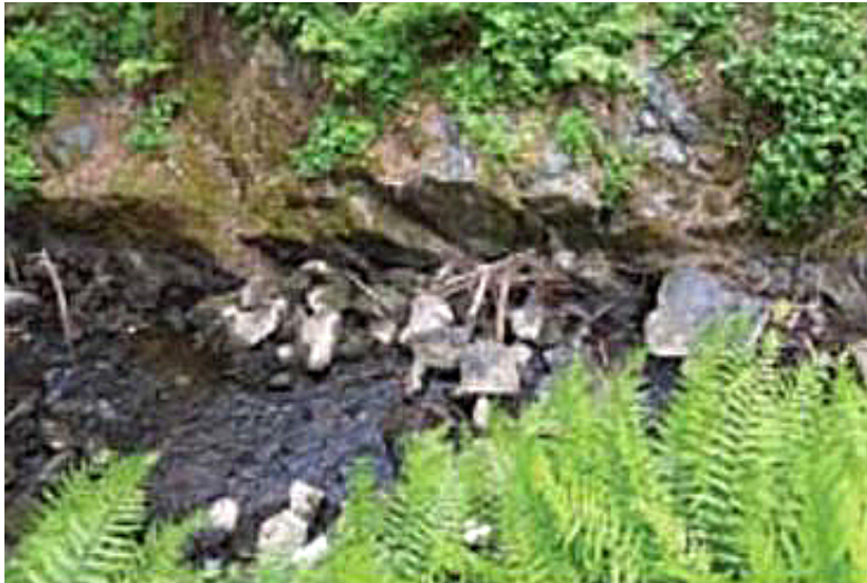
Den sprängda rännan.

I dagsläget är Lyckån en spillra av sitt forna jag och vegetationen på västra sidan nästan ogenomtränglig vilket gör en grundlig undersökning mycket svår.