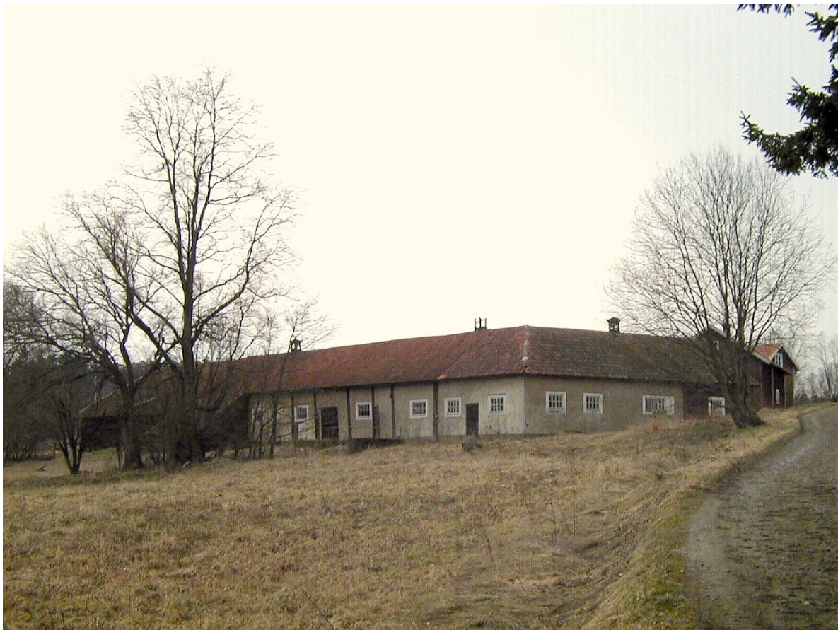
Västnora och en del av den gamla vägen

På andra sidan bron fortsätter vägen uppför motsatta branten, förbi en milsten och genom gamla Västnora by med Nedergården på vänster hand. Man färdas nu nedanför en utlöpare till Tungelstaåsen och sanden gör sig märkbar, tydligast i två sandtag, visserligen bådadera tömda, först ett litet och därpå ett större.