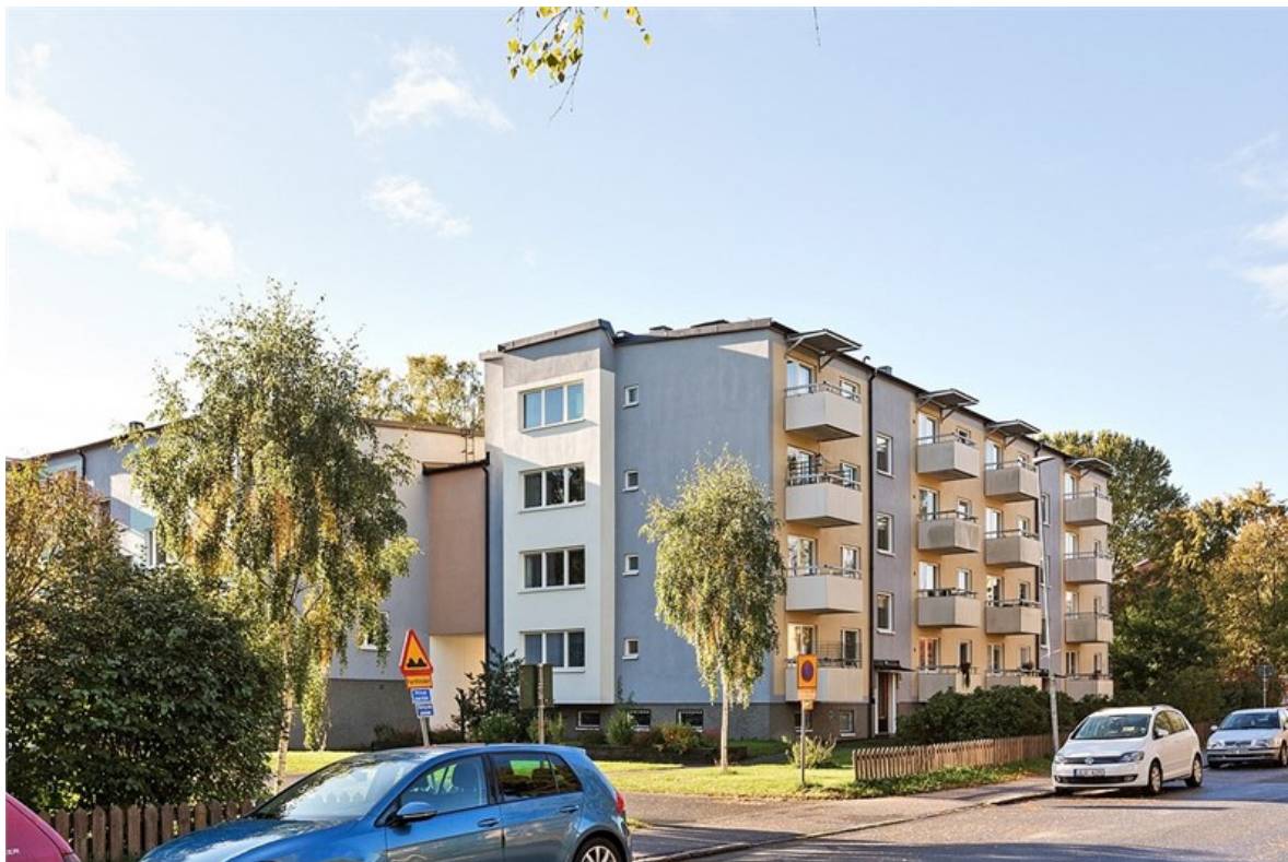
Åbygårdarna. här Ringvägen 48-50 år 2017.

Jag ser på nätet att min "förstalägenhet" på Ringvägen 50 är till salu!