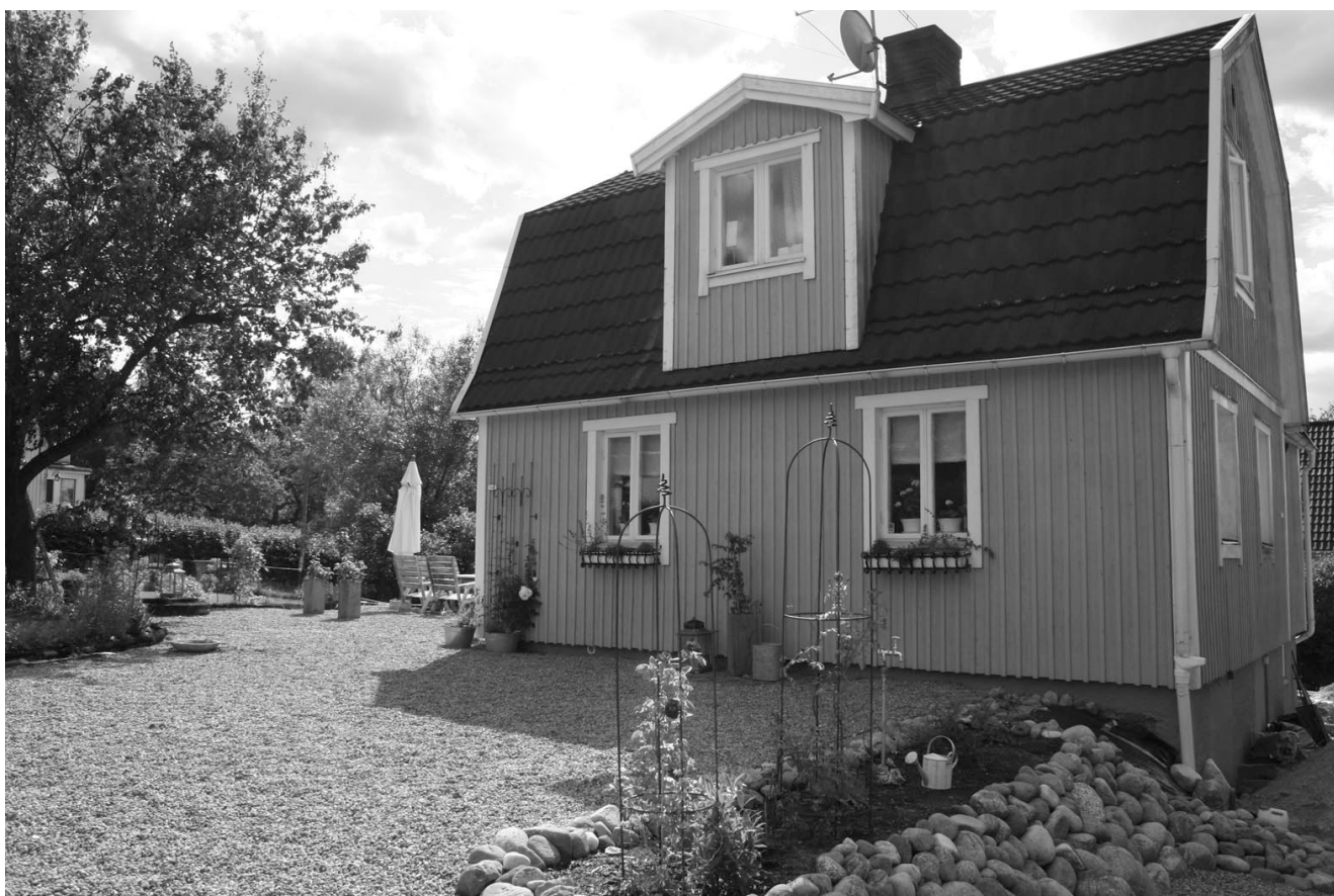
Vendelsö Allé 9 (Stockholmsv. 70)