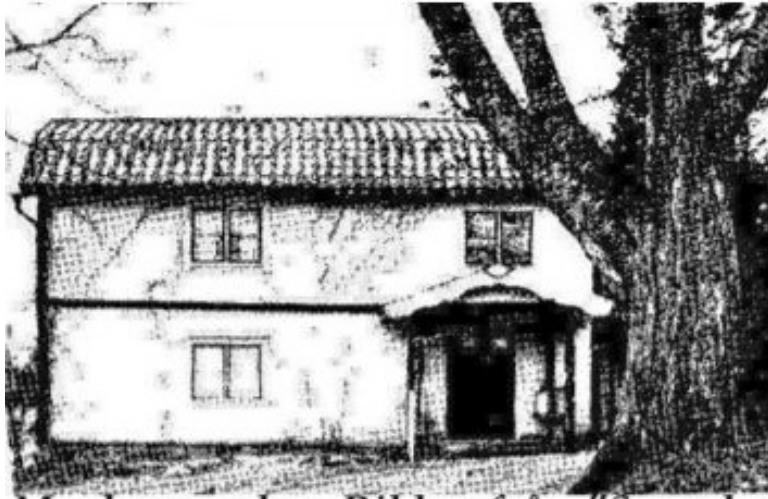
Mangårdsbyggnaden 1939. Återstår nu bara grunden.