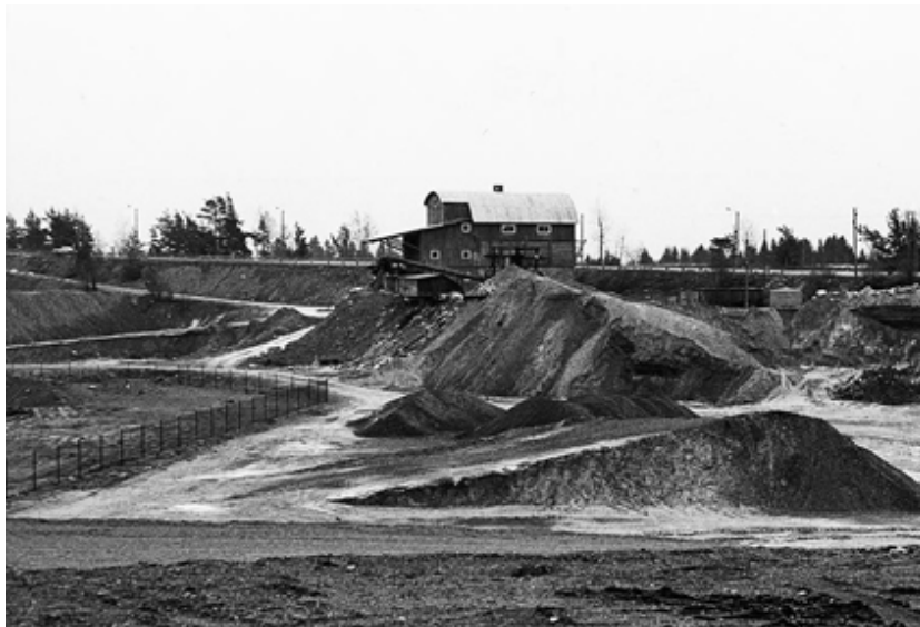
Bilden tagen ungefär från platsen där bilparkeringen finns idag.

När grustäkten lades ner byggde kommunen en idrottsplats i gropen, numera flera fotbollsplaner och en ishall. Döptes till Hanvedens IP.