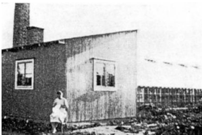
Ett av växthusen med den lilla bostaden.