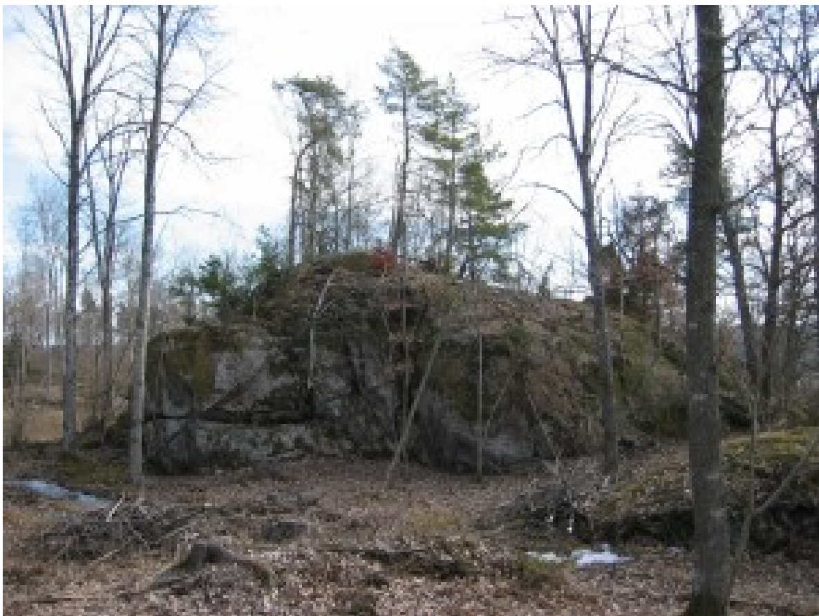
Ett mäktigt stenblock.

Utan att vara säker tror jag att denna södersluttning var bebodd ganska tidigt, den nu ganska beskedliga lilla ån nere i dalen har ju förr i tiden säkert varit en farbar vattenväg.