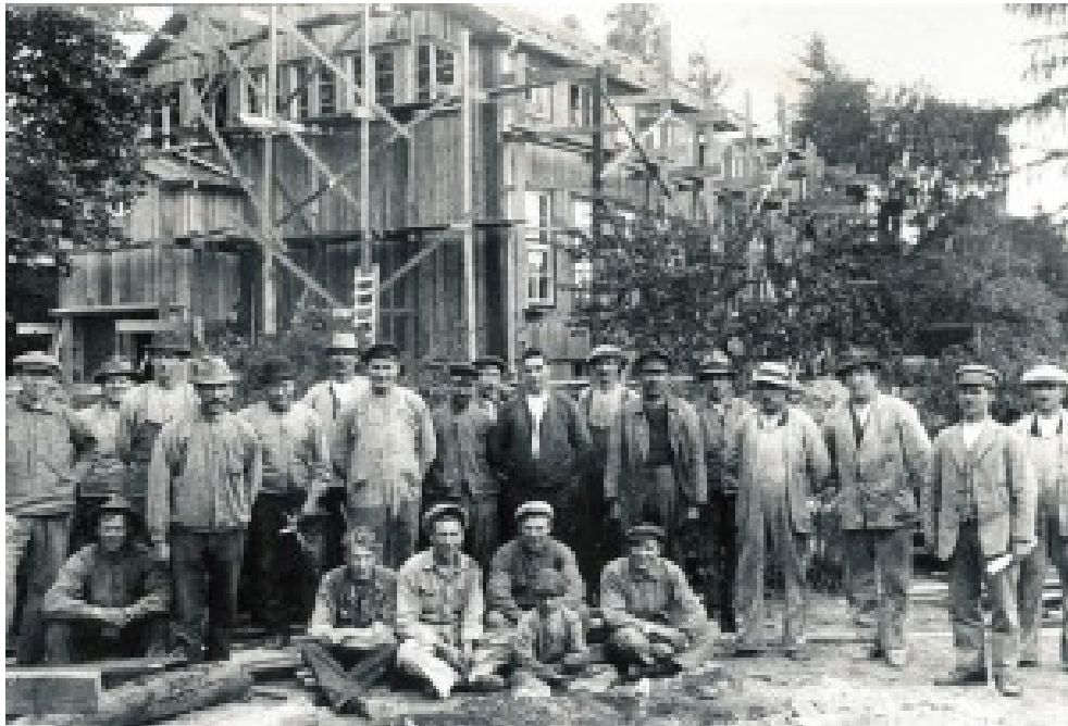
Här byggs skolan år 1922

Under året har ju en debatt pågått om utbyggnad runt Västerhaninge Centrum, skoltomten och markerna däromkring är aktuella enligt en byggplan som ännu inte är fastlagd.